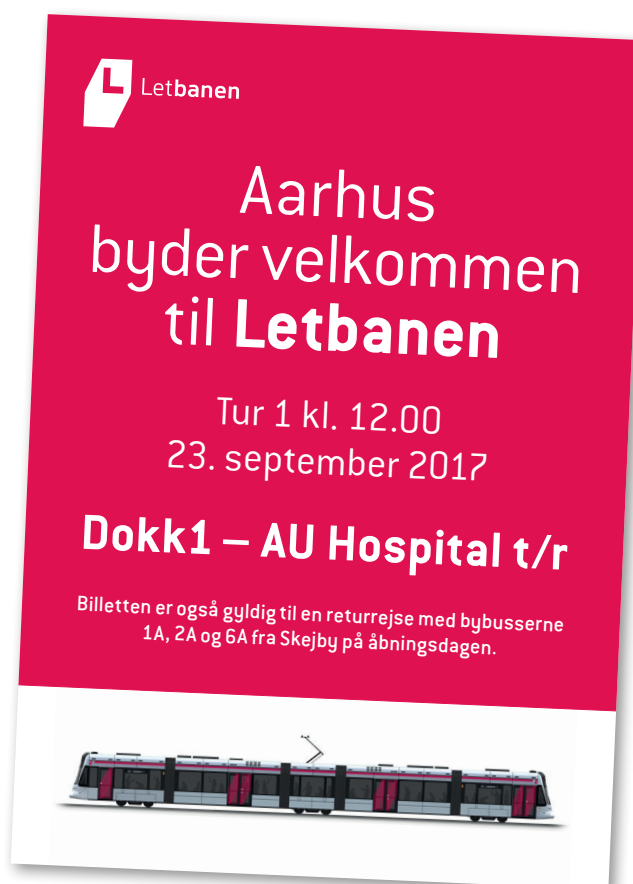
Billede af gratis billet