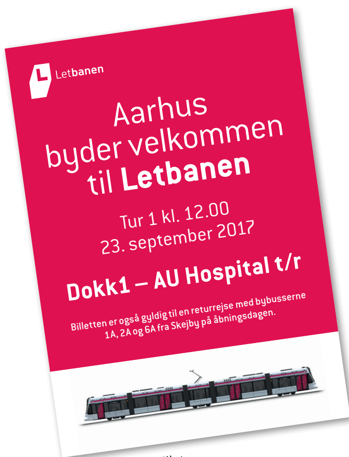
Billede af gratis billet

Danmarks første letbane er lige på trapperne, og kunderne stiller sikkert allerede spørgsmål om billetter, priser, køreplaner osv. Derfor får du her et overblik over de mest oplagte spørgsmål.